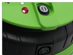
INDICATORE LUMINOSO DI SACCO PIENO