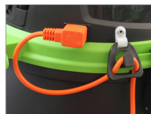
CAVO STACCABILE AD ALTA VISIBILITÀ DA 15 METRI