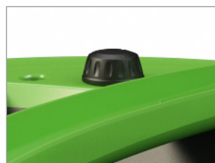
REGOLATORE DI VELOCITÀ E RUMOROSITÀ